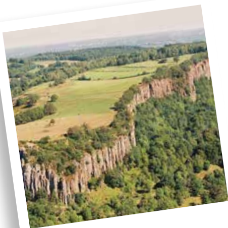
Bort les Orgues