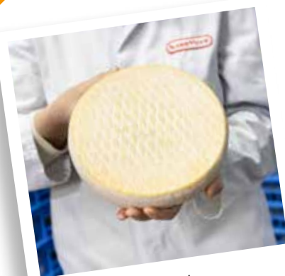
Fabrication du Saint Nectaire