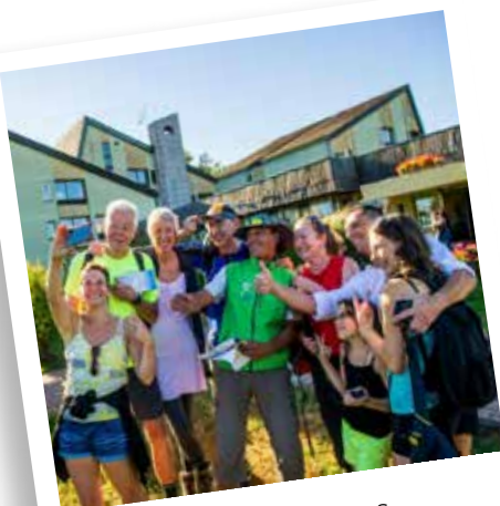
Village vacances «Le Domaine des Puys»