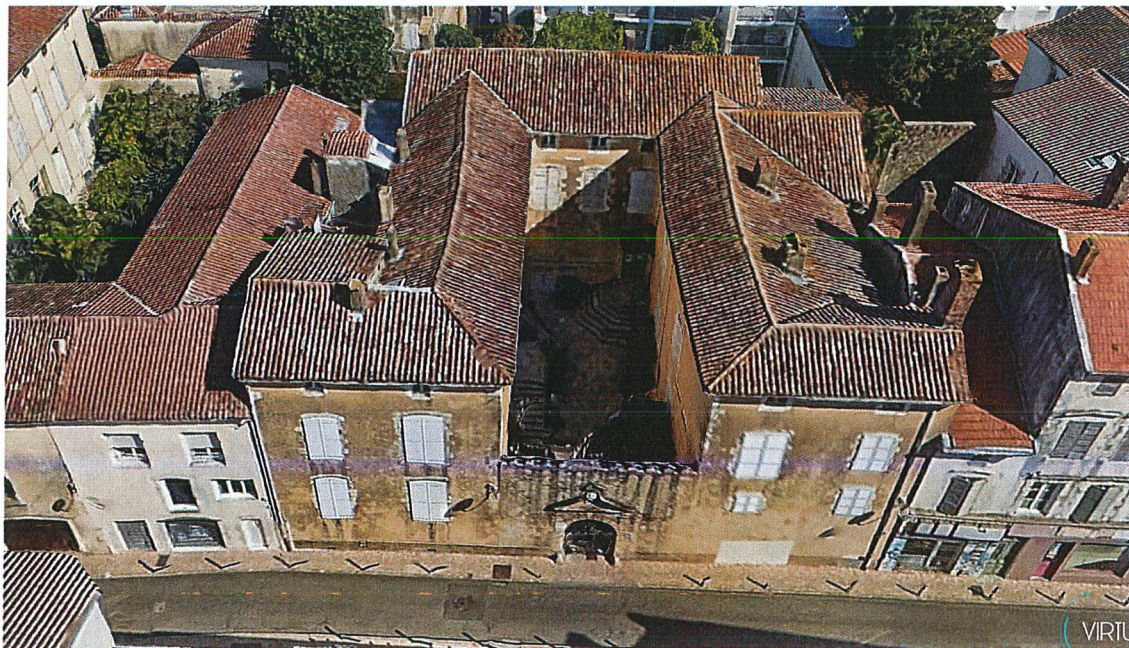
Vue aérienne photogrammétrique depuis l'ouest.