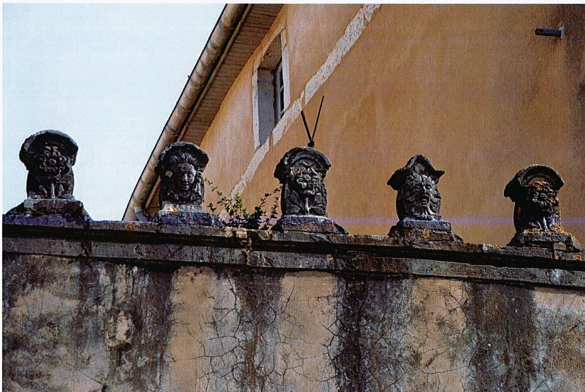
Crépeaux couronnant le mur de clôture.