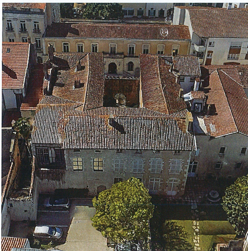
Vue aérienne photogrammétrique depuis l'est.