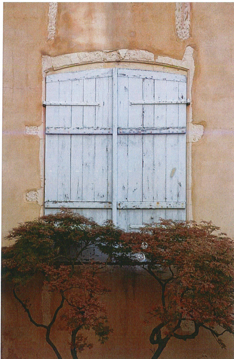
Une fenêtre de la façade nord de l'aile sud.