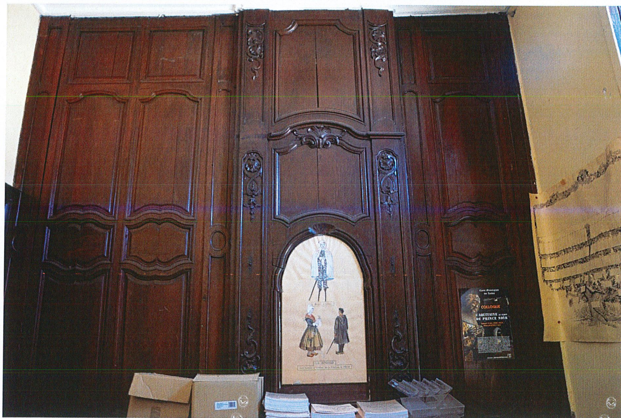
Décors d'un bureau.

Auteur de l'illustration : Linda Fascianella