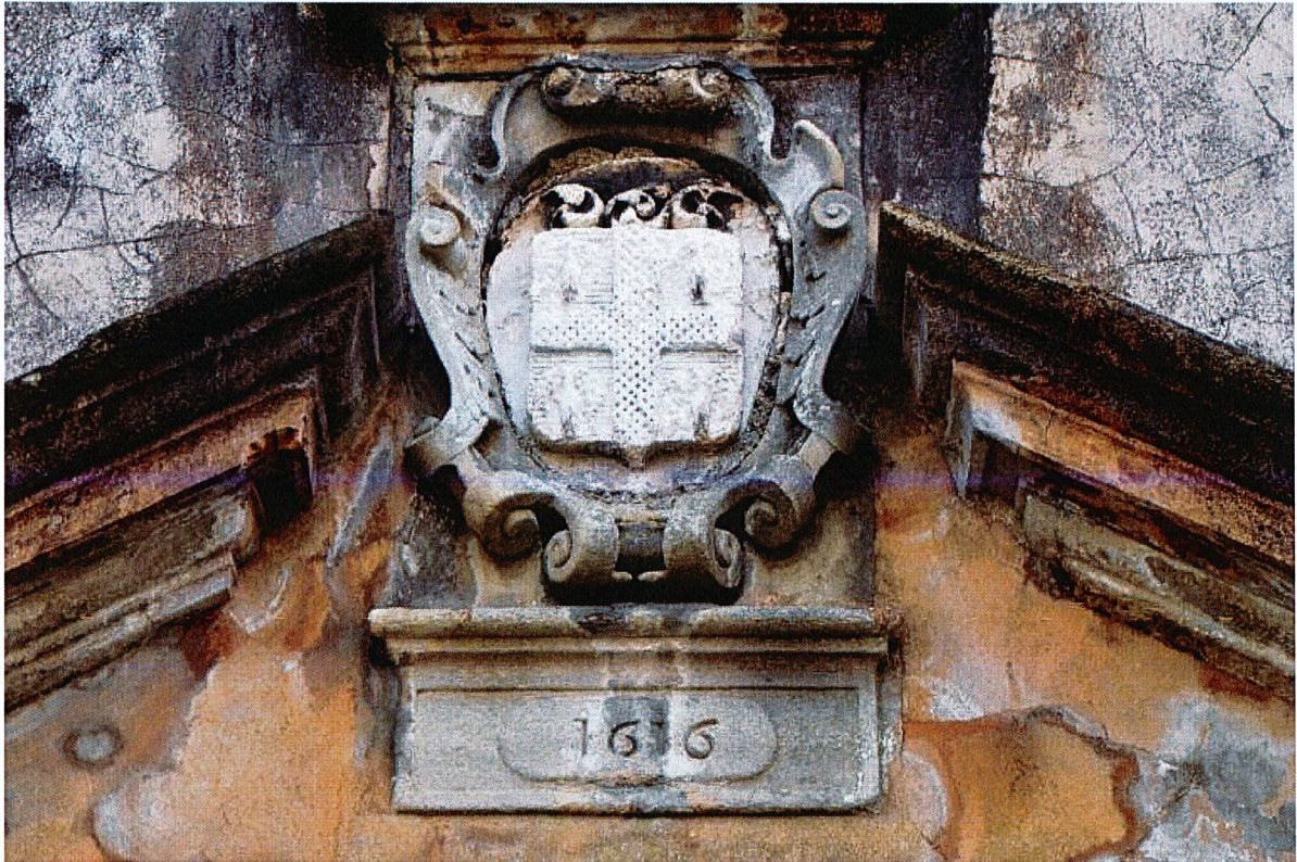
Détail du décor du portail : date et armes de la famille de Bachelier.