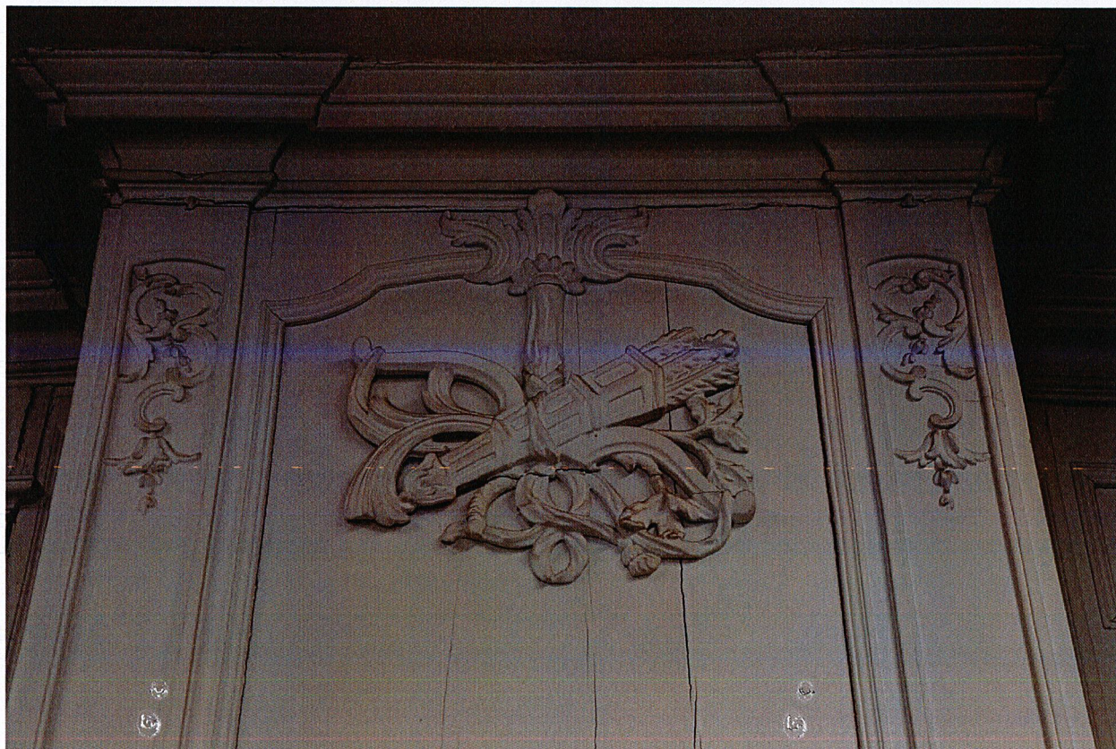
Détail du décor d'une cheminée du salon du premier étage.

Auteur de l'illustration : Linda Fascianella