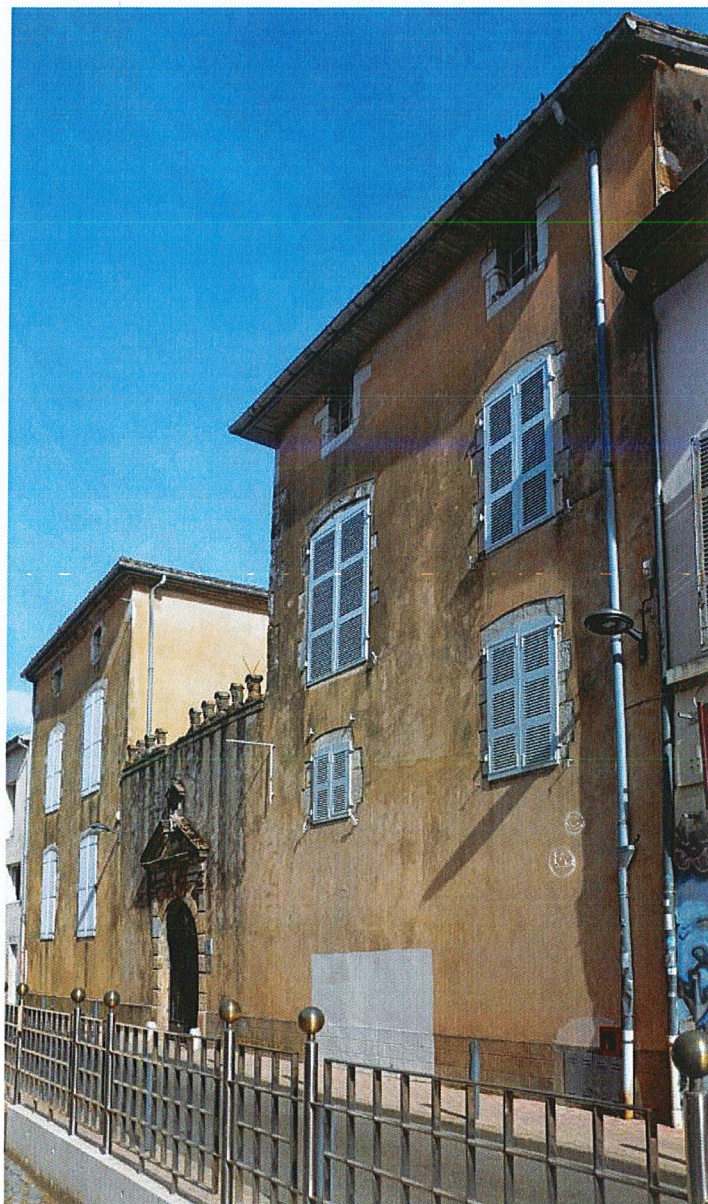
Façade sur rue vue depuis le sud-ouest.