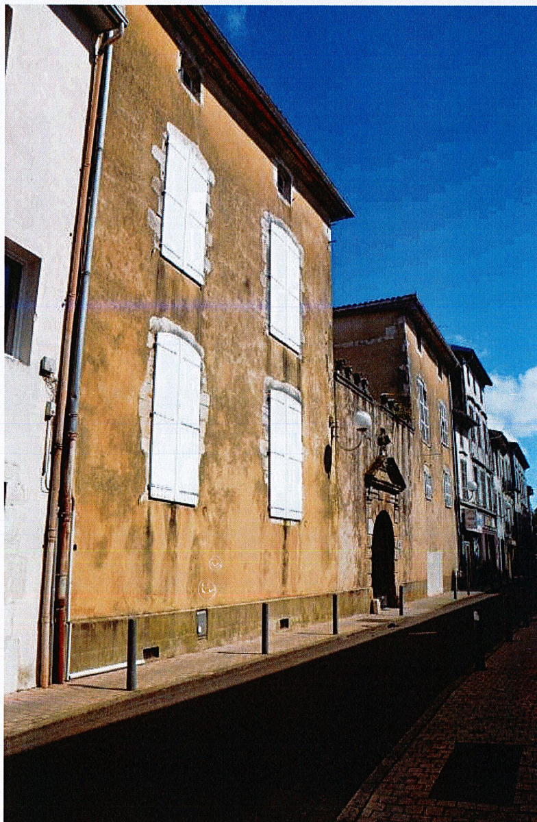
Façade sur rue, vue depuis le nord-ouest.