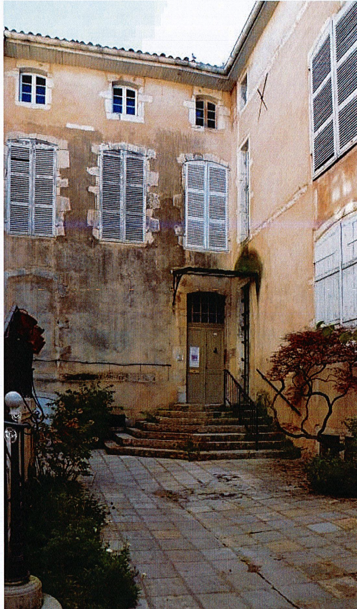
Façade ouest vue depuis la cour.