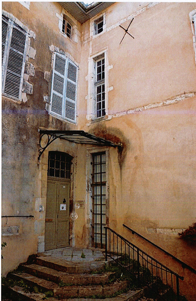
Angle sud-est : demi-croisées.