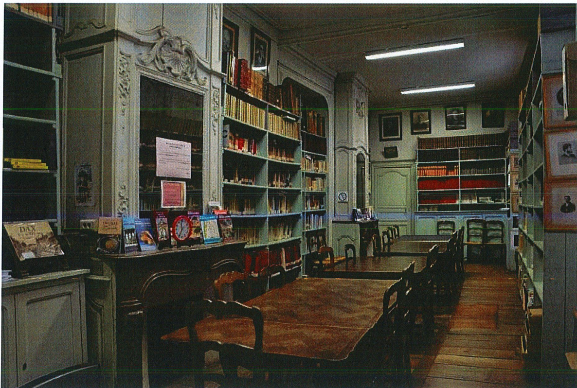
Salon (bibliothèque de la société de Borda).