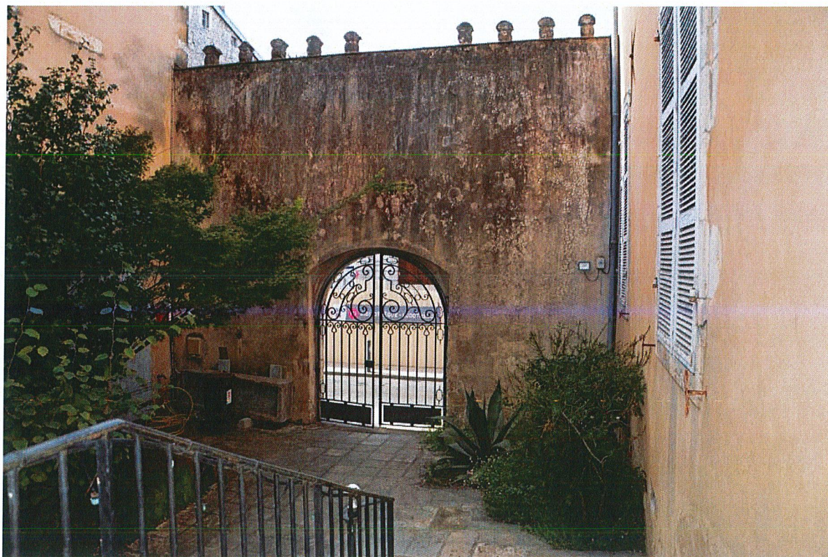
Mur de clôture vu depuis la cour.