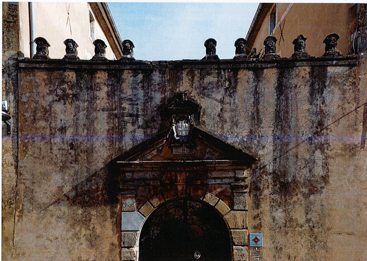
Mur de clôture et entrée de la cour.