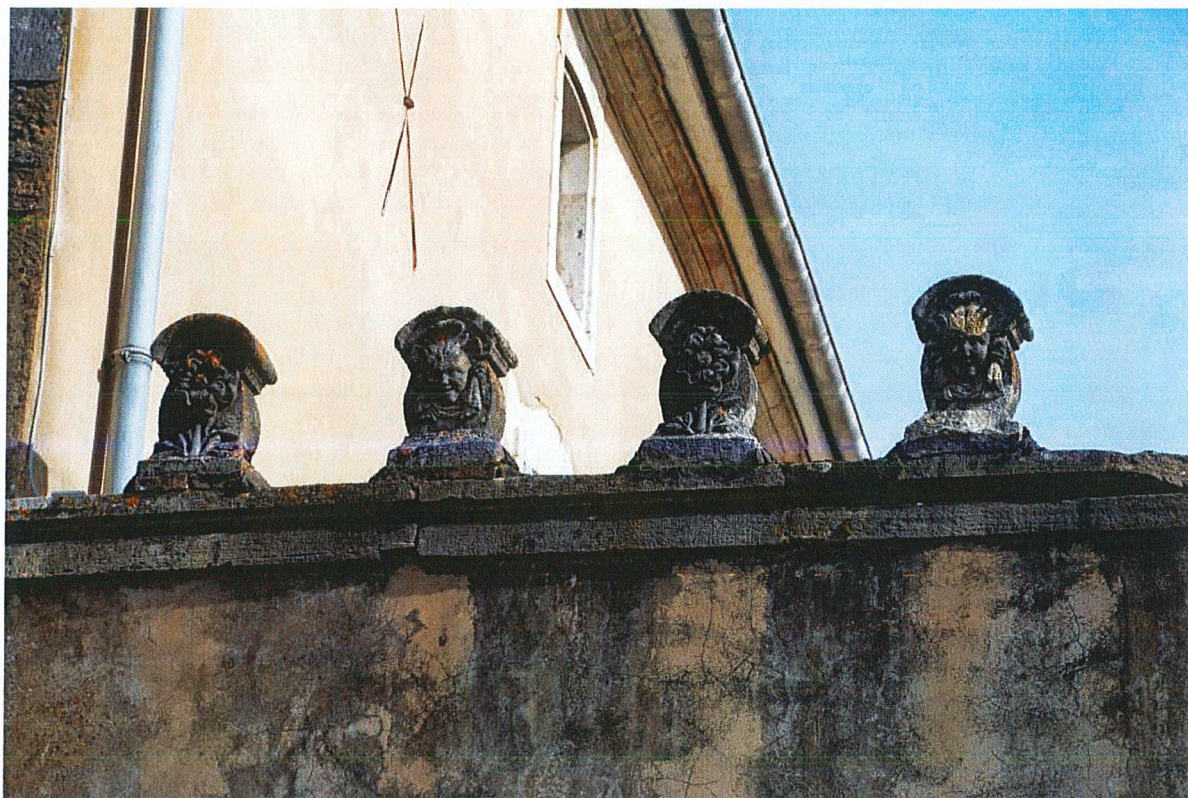
Créneaux couronnant le mur de clôture.