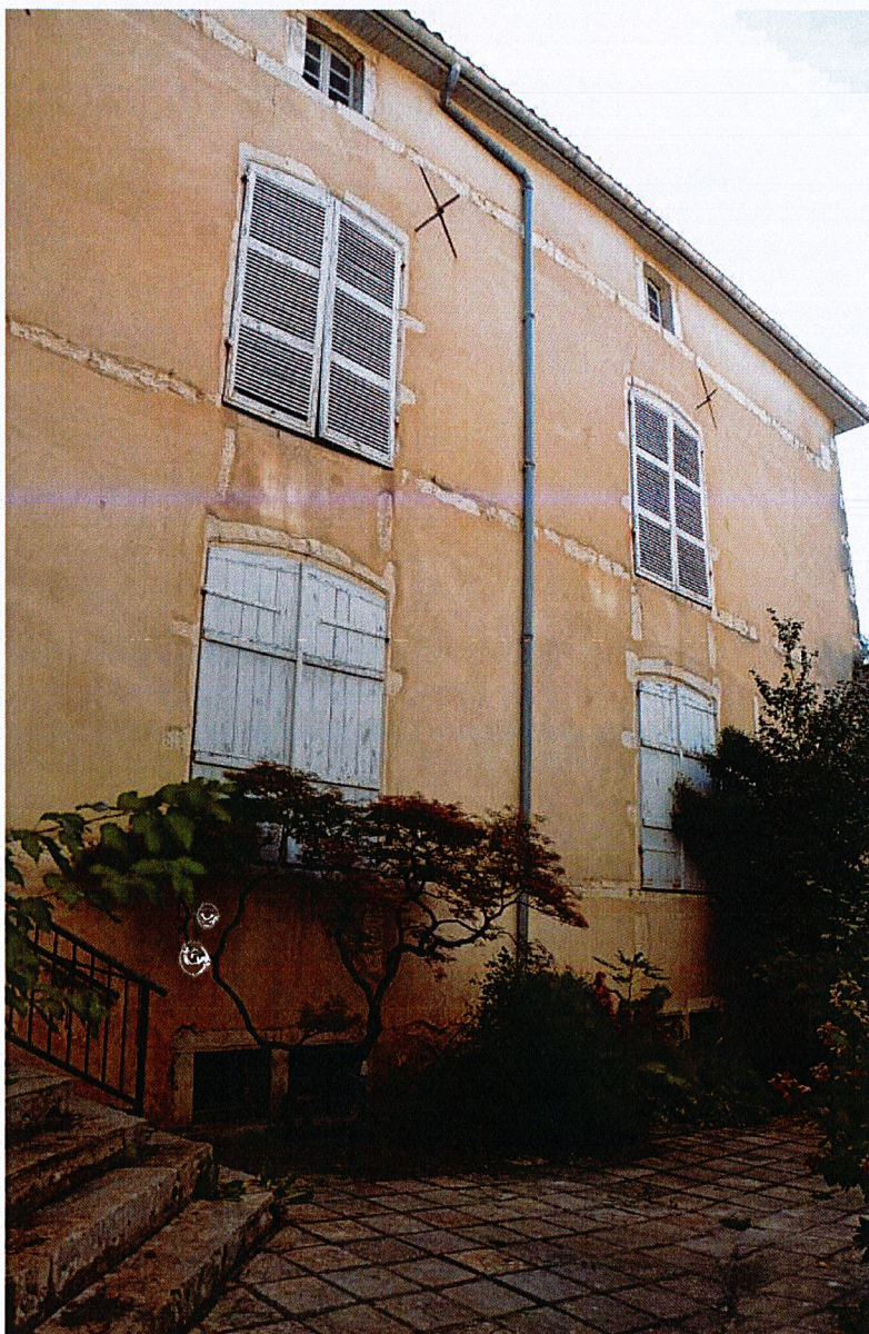
Façade nord de l'aile sud.