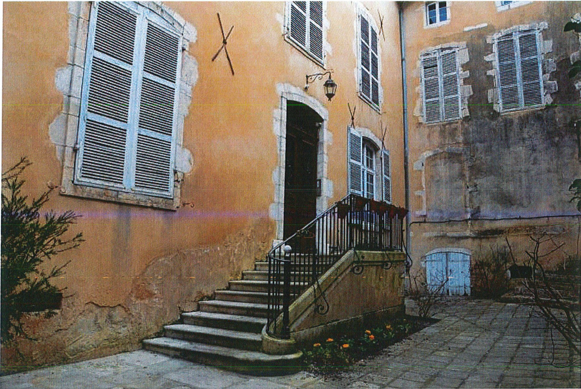
Cour intérieure : entrée nord.