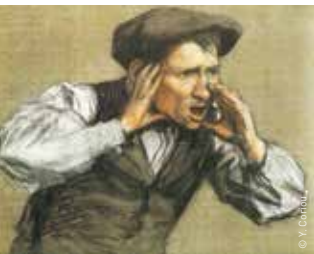
Etude - Combat d'ours et de chiens

Sa peinture s'inspire de ses racines rurales gasconnes.