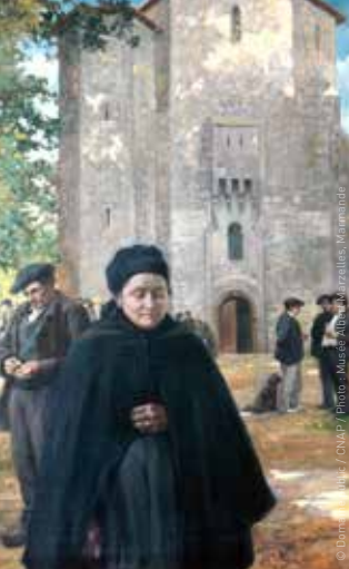
Sortie de Messe à Houeillès

Sa peinture s'inspire de ses racines rurales gasconnes.