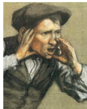
Étude - Combat d'ours et de chiens