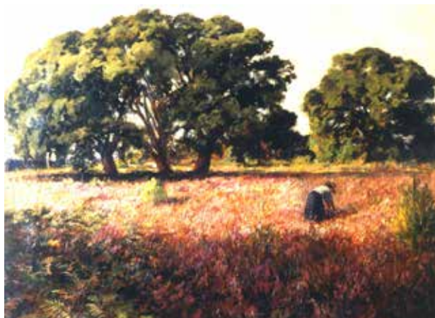
Champ de bruyère à Téchémort

Du mardi au samedi et le 1 er dimanche du mois de 14h à 18h. Tarifs : 2,5 € et 2,70 €