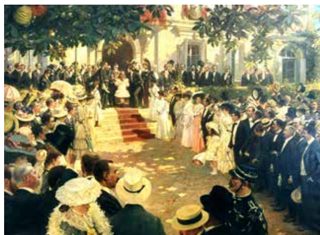
Visite du Président Fallières à Nérac