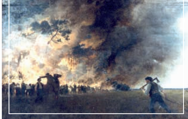
Incendie dans les Landes

Une aisance stylistique qui intègre tous les héritages du XIX e siècle Si l'art de Mondineu reste solidement ancré dans la figuration et ne cède pas aux sirènes des avant-gardes en ce début de 20 e siècle, le peintre est néanmoins capable de s'écarter stylistiquement de sa voie réaliste et de s'exprimer à travers d'autres sensibilités artistiques. Ses petites toiles rapidement brossées sur le vif ou nombre d'œuvres de grandes dimensions, telles la Scène de vannage à Couhin ou plus encore les Attelages au repos , conservent bien un souci naturaliste par l'exactitude ethnographique de la scène représentée, mais sur le plan pictural intègrent par leurs touches plus libres l'héritage de l'impressionnisme. Des paysages comme le Champ de bruyère à Téchemort puisent directement aux sources de l'école de Barbizon, si ce n'est que les paysages de Mondineu, à la différence de ceux des peintres de Barbizon, se suffisent rarement à eux-mêmes et se présentent rarement vides de personnages. C'est toujours l'Homme et son activité qui sont au centre des préoccupations de l'artiste, même lorsque le paysage semble jouer le premier rôle.